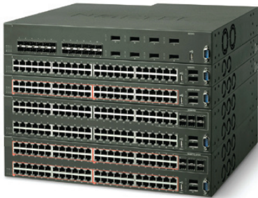
Коммутатор Ethernet Routing Switch 5600

Передовая в своем классе устойчивая технология стекирования компании Avaya обеспечивает высокую доступность для приложений по работе с данными и голосом, чувствительных к задержке и важных для бизнеса. До восьми коммутаторов Ethernet Routing Switch 5000 могут быть объединены в одно устойчивое стекированное решение с единым управлением и плотностью 400 портов с максимальным сроком безотказной работы даже при выходе из строя одного коммутатора в стеке.