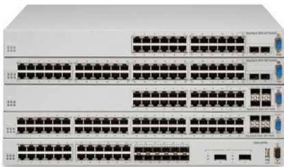
Коммутатор Ethernet Routing Switch 5500

Коммутатор Ethernet Routing Switch 5000 компании Avaya представляет собой набор высокопроизводительных стекируемых коммутаторов локальной сети, которые обеспечивают устойчивость, безопасность и готовность к конвергенции, требуемые в современных коммутационных шкафах высокого класса, вычислительных центрах большой мощности и более мелких базовых окружениях.